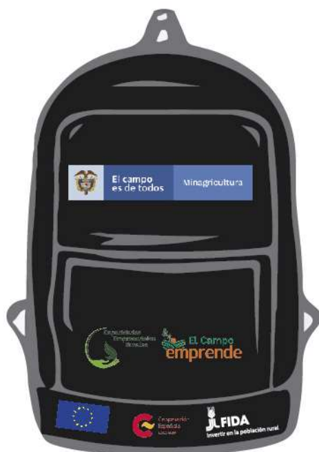
Imagen 2. Referencia para la ubicación de logos en morral

En la parte frontal inferior: 1 logo de FIDA, 1 de AECID y 1 logo de UE, cada uno de 3 cm de alto x 6,5 de largo. Se debe tener en cuenta proporcionalidad y simetría