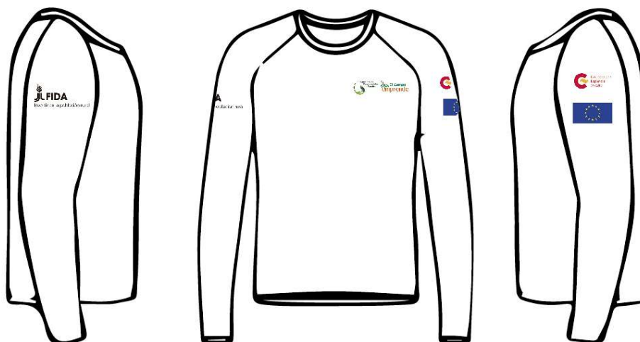
Imagen 5. Referencia para la ubicación de logos en camibuso manga larga

En la manga de la mano izquierda: 1 logo de AECID y 1 de logo de UE. Cada logo debe contar con un tamaño 5 cm de largo x 2 cm de alto. Se debe tener en cuenta proporcionalidad y simetría.