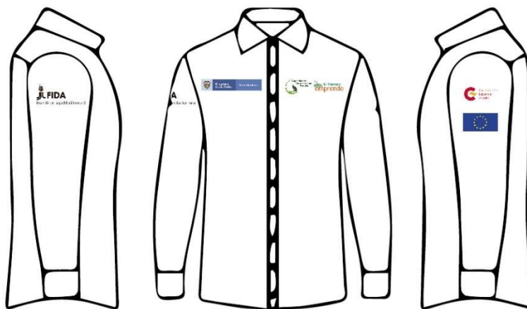
Imagen 3. Referencia para la ubicación de logos en camisa tipo Oxford

En la manga de la mano izquierda: 1 logo de AECID y 1 logo de UE. Cada logo debe contar con un tamaño 5 cm de largo x 2 cm de alto. Se debe tener en cuenta proporcionalidad y simetría.